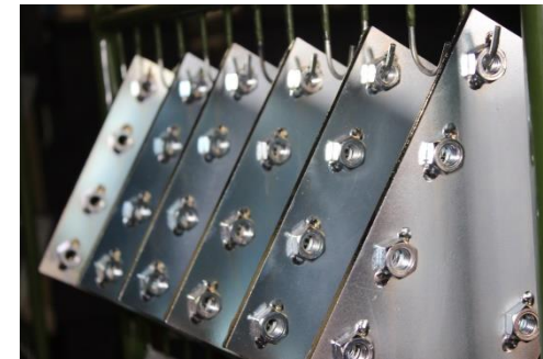
Galvanisches Verzinken von Stahl und Guss