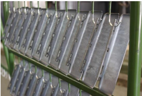
Passivieren von Guss

Unser Leistungsspektrum umfasst Beratung, Beschichtung, 100% Kontrollen und Montagen von Baugruppen.